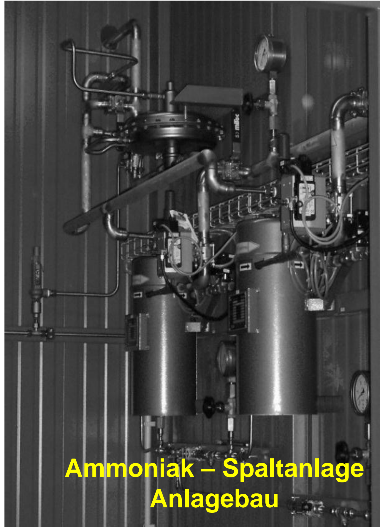
Ammoniak – Spaltanlage Anlagebau